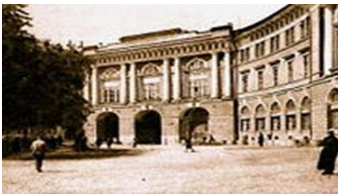
Здание Министерства народного просвещения в Санкт-Петербурге на Чернышевской (Ломоносовской) площади. Архитектор К.И. Росси

История школьных медалей в России начинается в 1828 году с принятием «Устава гимназий и училищ уездных и приходских». В XIX веке первая российская гимназия последовала традициям своих французских коллег, выдав своему лучшему выпускнику