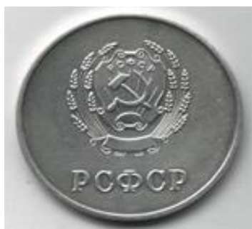
Образцы школьных медалей. 1960 г.

Диаметр медалей увеличен до 40 мм, материал изготовления изменен на томпак для золотых медалей и мельхиор для серебряных. Драгметаллы в медалях остались лишь в виде напыления.